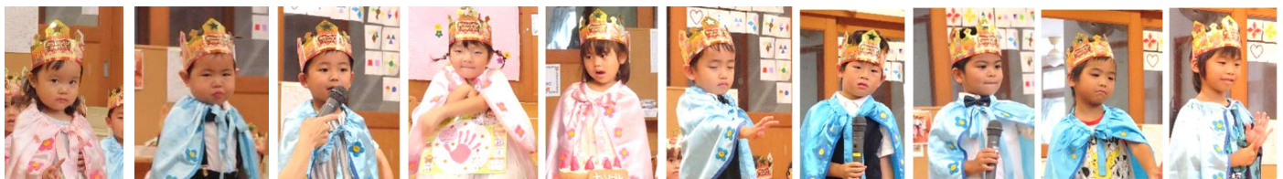
7月生まれのおともだち おたんじょうび おめでとう