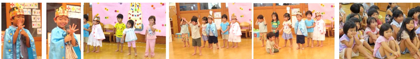
ゆりクラスの出し物「バナナ体操」を踊りました！！ ちょっとドキドキ、緊張していた子ども達です