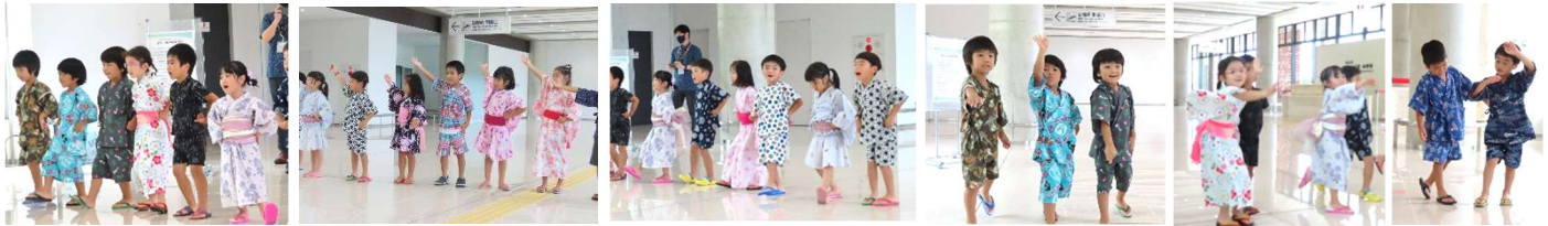
JAL の七夕イベント(空港)に参加。元気いっぱい歌って・踊って 拍手喝采で笑顔の子ども達でした