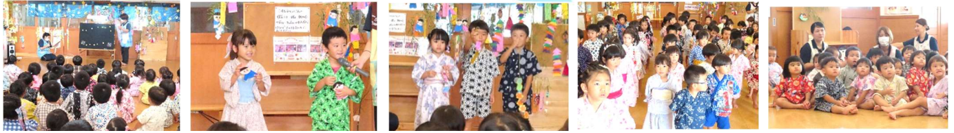
七夕集会では、由来を聞いたり、作った笹飾りを紹介したり、元気いっぱい歌って過ごしました